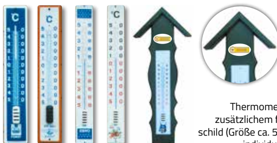
Thermometer auf Holzgrund mit zusätzlichem flachen, ovalen Emaille-schild (Größe ca. 50 x 80 mm) mit Ihrem individuellen Sonderaufdruck: Preis auf Anfrage

Die Preise gelten inklusive Verpackung und ohne Sonderaufdruck. Zuschlag für Sonderaufdruck: nach Aufwand