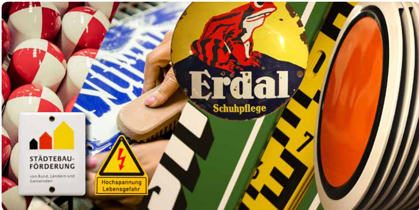
Preise auf Anfrage