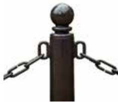
Kettenöse Typ B