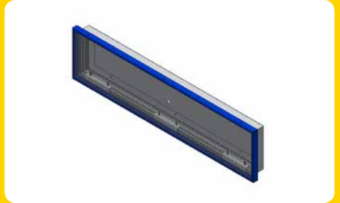
Einseitiges Schild für direkte Wandbefestigung