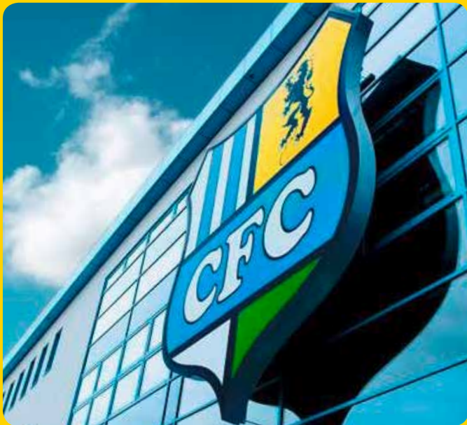
36 m 2 Spanntuchtransparent mit LED- Ausleuchtung