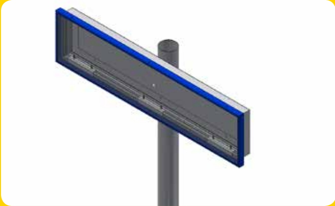
Einseitiges Schild mit Konsole für Mastbefestigung

Einseitiges Gehäuse P96 mit innovativer Haube, 4mm PC Front, rückseitig gebohrte Löcher, 2m Anschlusskabel fest angeklemt, Kabelführung links oder rechts wählbar, Pulverbeschichtung nach Wahl.