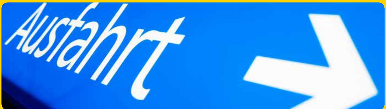
Parkhaus-Schild, transluzente Folie geplottet, doppelseitig