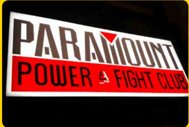
Firmenschild, transluzente Folie im Digitaldruck, einseitig mit Wandbefestigung.