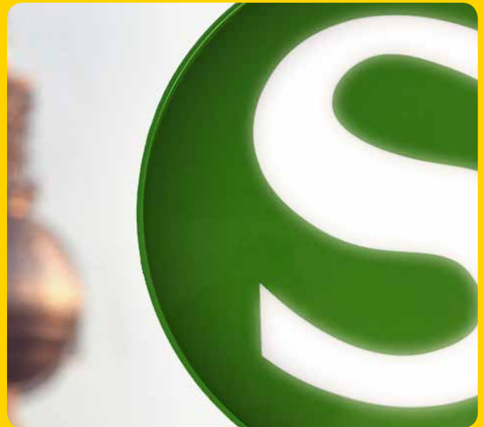
Rundformen mit Bildmarke, innenbeleuchtet