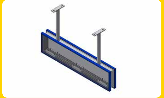
Doppelseitiges Schild mit Deckenbefestigung