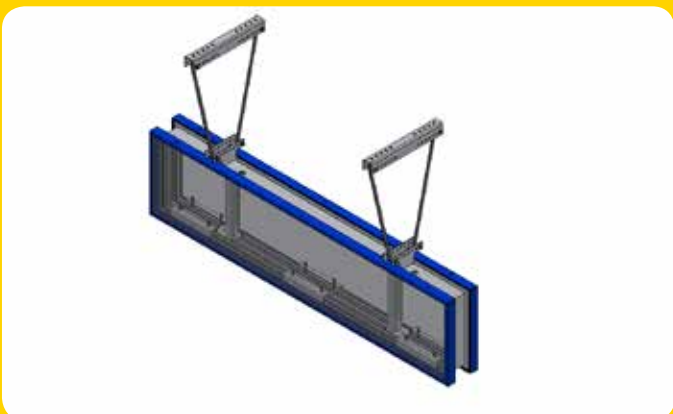
Doppelseitiges Schild mit Kettenabhängung

Doppelseitiges Gehäuse P50 mit innovativer Haube, 4mm PC Front, innenliegende Aussteifung mit Aufnahme zur Deckenabhängung, 2m Anschlusskabel fest angeklemt, Kabelführung links oder rechts wählbar, Pulverbeschichtung nach Wahl.